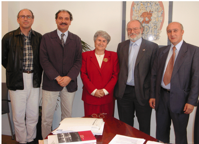
Responsables de les agències d'avaluació autonòmiques a la seu de l'AQU