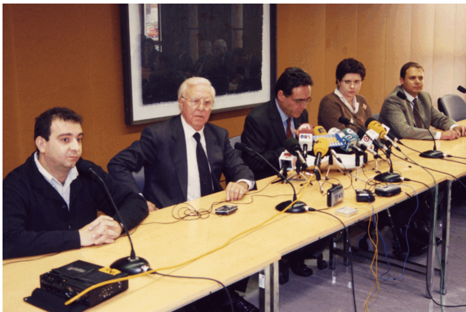
El rector i el president del Consell Social de la URV amb responsables dels projectes premiats

de Medicina i Ciències de la Salut, han estat guardonats enguany amb els premis que el Consejo de Coordinación Universitaria del Ministerio de Educación, Cultura y Deporte atorga a les accions de millora implantades a les universitats.