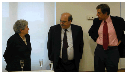
El president i la directora de l'AQU amb el conseller