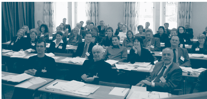
Experts, responsables dels Erasmus Mundus i membres de les agències de qualitat en la conferència inaugural del TEEP II

també ha de garantir la creació de l'EEES, ha de ser més atesa. Alhora, cal pensar que el màster, a causa de la seva especialització i sovint orientació a la recerca, esdevé un àmbit acadèmic altament interessant per promoure la mobilitat europea, tant entre professorat vinculat a la recerca com molt especialment entre estudiants, alguns d'ells futurs investigadors.