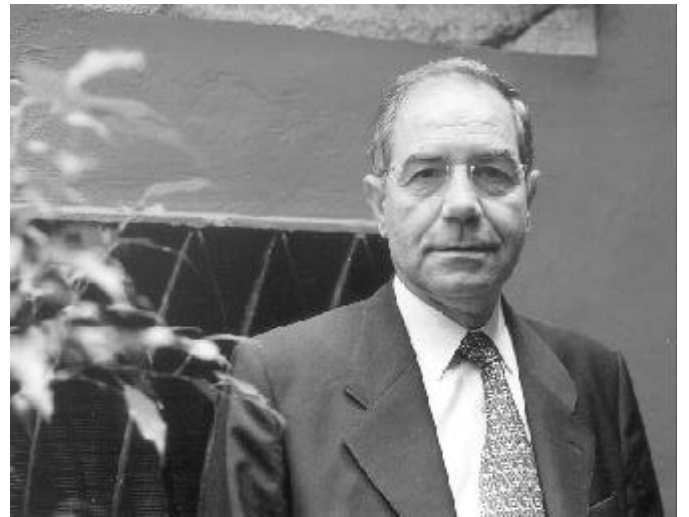
El president del Consell Social de la UdL vol obrir la universitat a la societat

La campanya consisteix a parlar personalment amb tots i cadascun dels 17 col·lectius en què s'ha dividit la societat lleidatana, des de col·legis professionals fins a mestresses de