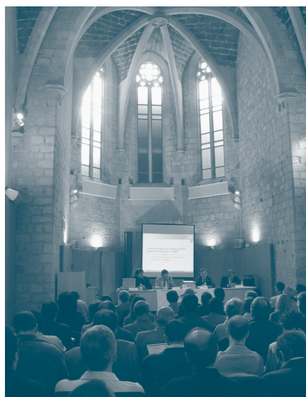
Benvinguda i presentació del Taller de Girona, Sala de Graus de la Facultat de Lletres de la UdG

Perspectives que envolten l'elaboració dels POP. La gestió que demana el nou marc és complexa. Així mateix, les diverses fases del procés d'implantació dels nous títols poden exigir models i estructures organitzatives diferents en cada moment. Caldrà, però, tenir en compte les estructures que ja funcionen a l'hora d'introduir aquestes modificacions, i determinar si és convenient superar les fronteres de les unitats orgàniques existents.