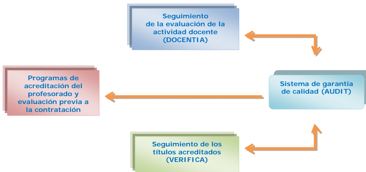
Figura 1: Retroalimentación entre AUDIT, DOCENTIA y VERIFICA

En consecuencia, el seguimiento de la evaluación de la actividad docente del profesorado aporta información necesaria para el seguimiento de los títulos acreditados que se imparten en esa universidad.