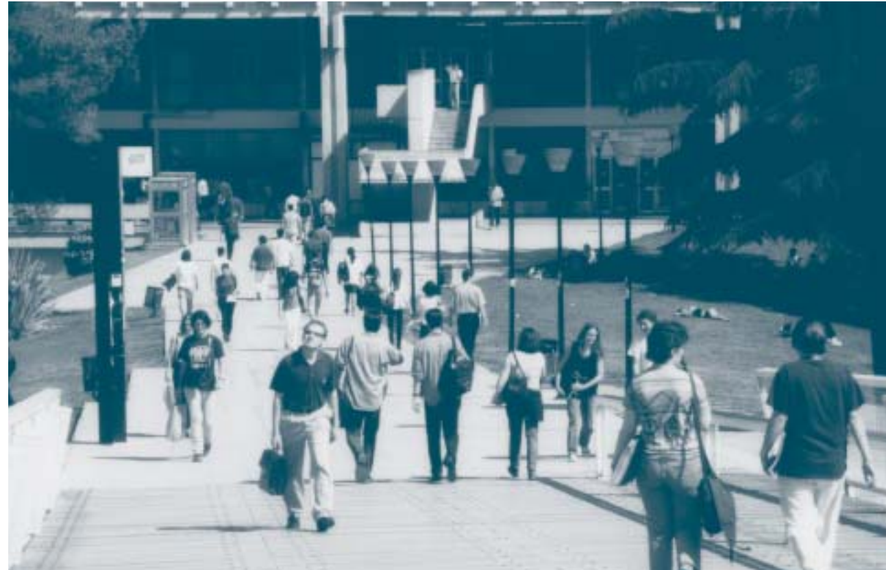
Eix central del campus de la Universitat Autònoma de Barcelona.

dóna poc marge de maniobra, la qual cosa pot ajudar a repensar, en el moment en què s'està parlant d'una nova manera de comptar els crèdits, les hores setmanals de classe que actualment s'imparteixen. Hem pogut constatar que tendeixen a dedicar més hores a l'estudi els estudiants que menys ho necessiten, si tenim en compte que tenen millors notes d'accés a la universitat, cosa que té relació amb el nombre important d'estudiants que no estan identificats amb els valors expressius de la universitat.