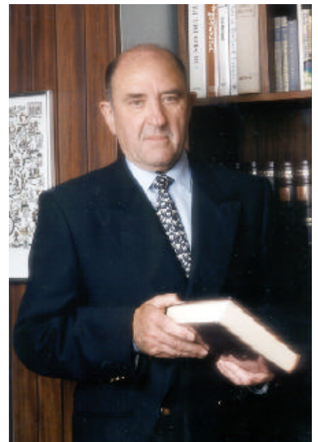
Freixes, President del Consell Social de la URV

AQ.- Com podria influir en la URV el possible establiment d’un