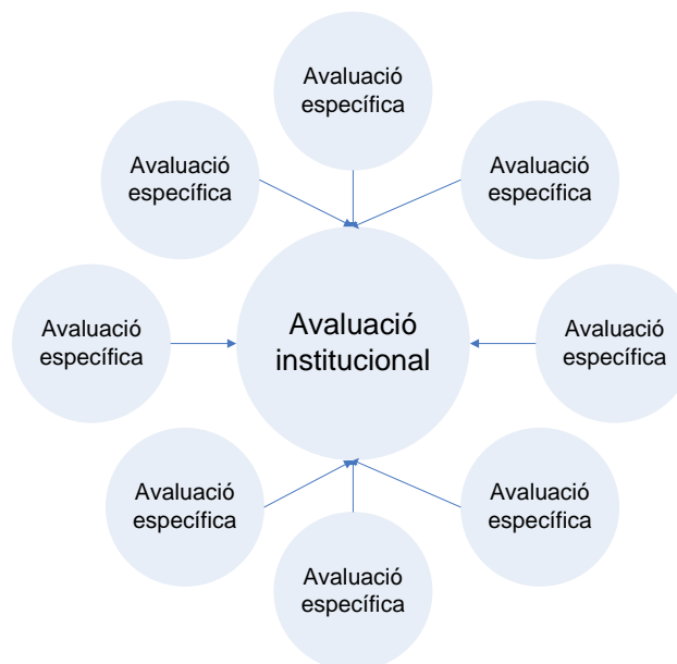
Esquema 2. les unitats d'avaluació

Consegüentment, s'han definit dues tipologies de comitès: un comitè institucional i comitès específics per a l'avaluació de les titulacions.